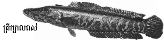
ត្រីក្បាលពស់

ការមានត្រីប្រភេទទាំងនេះ នៅក្នុងសហរដ្ឋអាមេរិក គឺជាការខុសច្បាប់ :