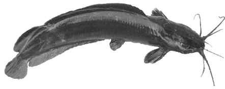
ត្រីធ្នាំង យាត្រា

ការមានត្រីប្រភេទទាំងនេះ នៅកន្លែងខ្លះក្នុងភាគឦសាននៃសហរដ្ឋអាមេរិក ដោយពុំមានសំបុត្រអនុញ្ញាត គឺជាការខុសច្បាប់ :